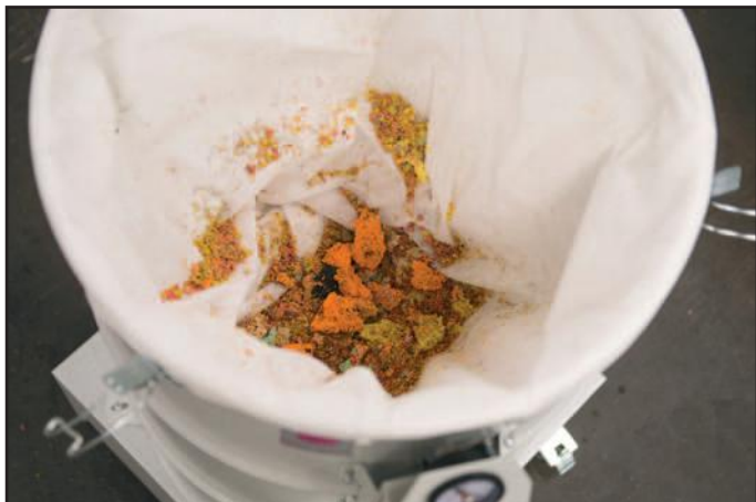
Zbiranje delcev odrezkov v koprenasti vreči

Industrijski sesalniki serije DAV-SB so primerni za vsesavanje sprimkov in delcev odrezkov (npr. papir, plastika, material) iz proizvodnih strojev. Zmogljivost sesanja, konstrukcija in mere so prilagojene zahtevam proizvodnih strojev, na katere so vgrajeni. Delci odrezkov se vsesavajo in zbirajo v vreči filtra za razred prahu M. Tako je zbrani material dobro zatesnjen, prostornino filtra pa je mogoče izkoristiti optimalno. Napolnjeni filter je mogoče preprosto odstraniti iz sesalnika.