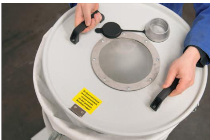
Preprosta menjava filtra z dvigovanjem pokrova