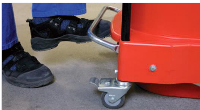
Najpreprostejše »upravljanje« z nožno ročico za praznjenje