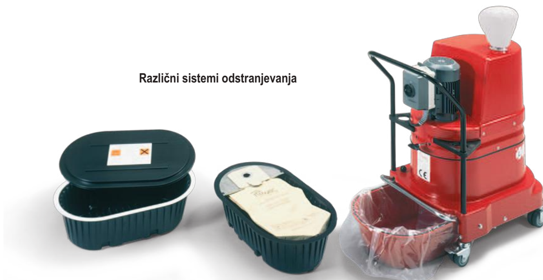
Posoda za odstranjevanje s pokrovom